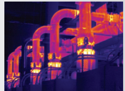
MultiSharp™-Fokus bei Ti450 PRO