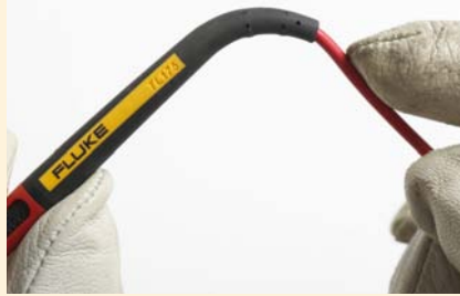
Extreme Zugentlastung, für über 30.000 Biegungen geprüft