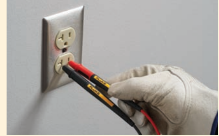
Messspitze für CAT II-Messungen verlängern