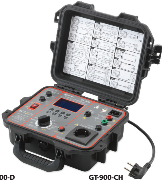
GT-900-D Gerätetester für Prüfungen nach DIN VDE 0701-0702 und DGUV Vorschrift 3 (BGV A3) mit Schuko Netz-kabel und Schuko Prüf-/Netzsteckdose.