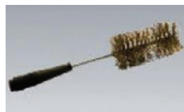
PAT-BRUSH Bürstensonde 4 mm Stecktechnik