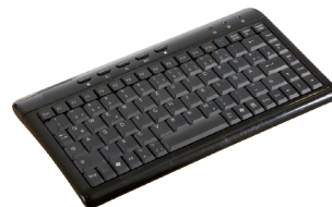
KBGE-MT204S USB Tastatur