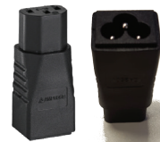
PA-1 Adapter Kaltgeräte auf Klebblatt (IEC C6-C13)