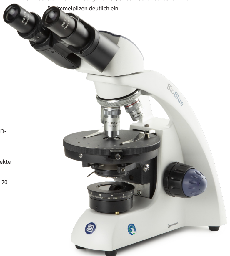
● Polarisation-Modell BB.4260-P-HLED

APL (Antimicrobial Protection Layer) ist eine revolutionäre Farbbehandlung für die kritischsten Teile unserer Produkte. Ein Mikroskop mit APL schränkt den Wachstum von Mikroorganismen, einschließlich Bakterien und Schimmelpilzen deutlich ein