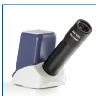
Digital Monokularer Kopf