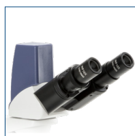
Digital Binokularer Kopf